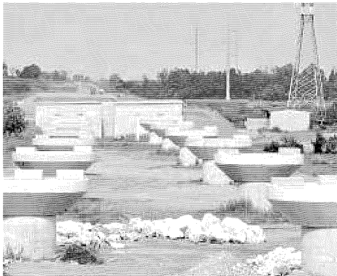
Il cantiere della Brebemi per il ponte sul fiume Oglio

(Chiari nord, Chiari sud, Caravaggio nord, Caravaggio sud)